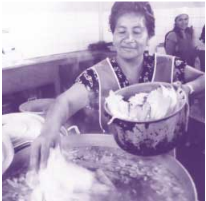
CARE / Fred House