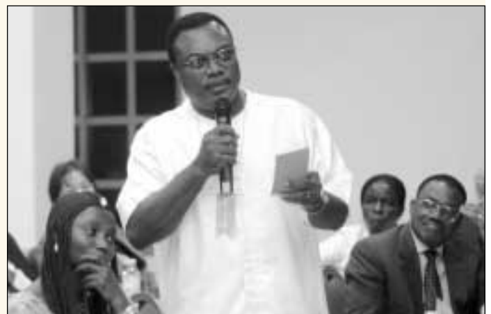
Courage Quashigah, ministre de l'Alimentation et de l'Agriculture au Ghana, prend la parole durant une discussion.