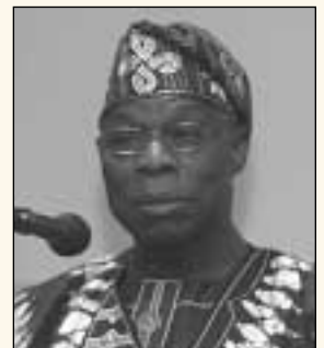
Yoweri K. Museveni, président d'Ouganda, Abdoulaye Wade, président du Sénégal, et Olusegun Obasanjo, président du Nigeria, ont chacun prononcé un discours lors de la séance d'ouverture.