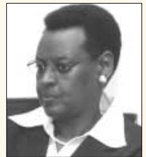
Janet Museveni, première dame d'Ouganda, décrit l'approche novatrice utilisée par son pays pour combattre le VIH/SIDA.