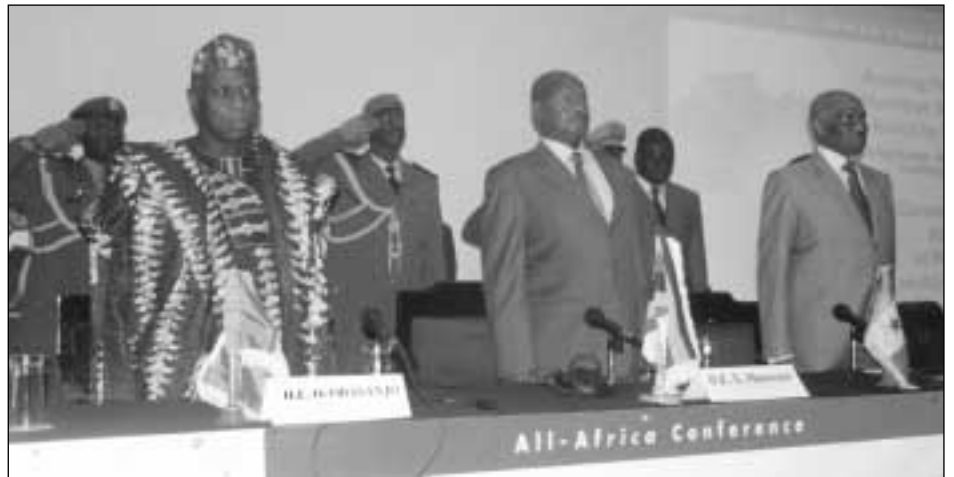
Présidents Obasanjo, Museveni et Wade, debouts pendant l'hymne national ougandais lors de l'ouverture officielle de la conférence

—Yoweri K. Museveni, président de la République d'Ouganda