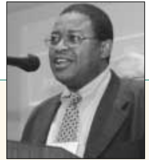
Monty Jones, du Sierra Leone, a été nommé gagnant du World Food Prize 2004 pour ses avancées dans la culture du riz.